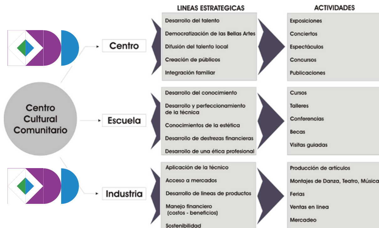
Imagen capturada de la consultoría Formulación Participativa de un Proyecto de Centro Cultural Comunitario del Barrio Santa Lucía Santiago, República Dominicana, página 16.

Se propone la implementación de estos tres ejes de actuación según el siguiente esquema.