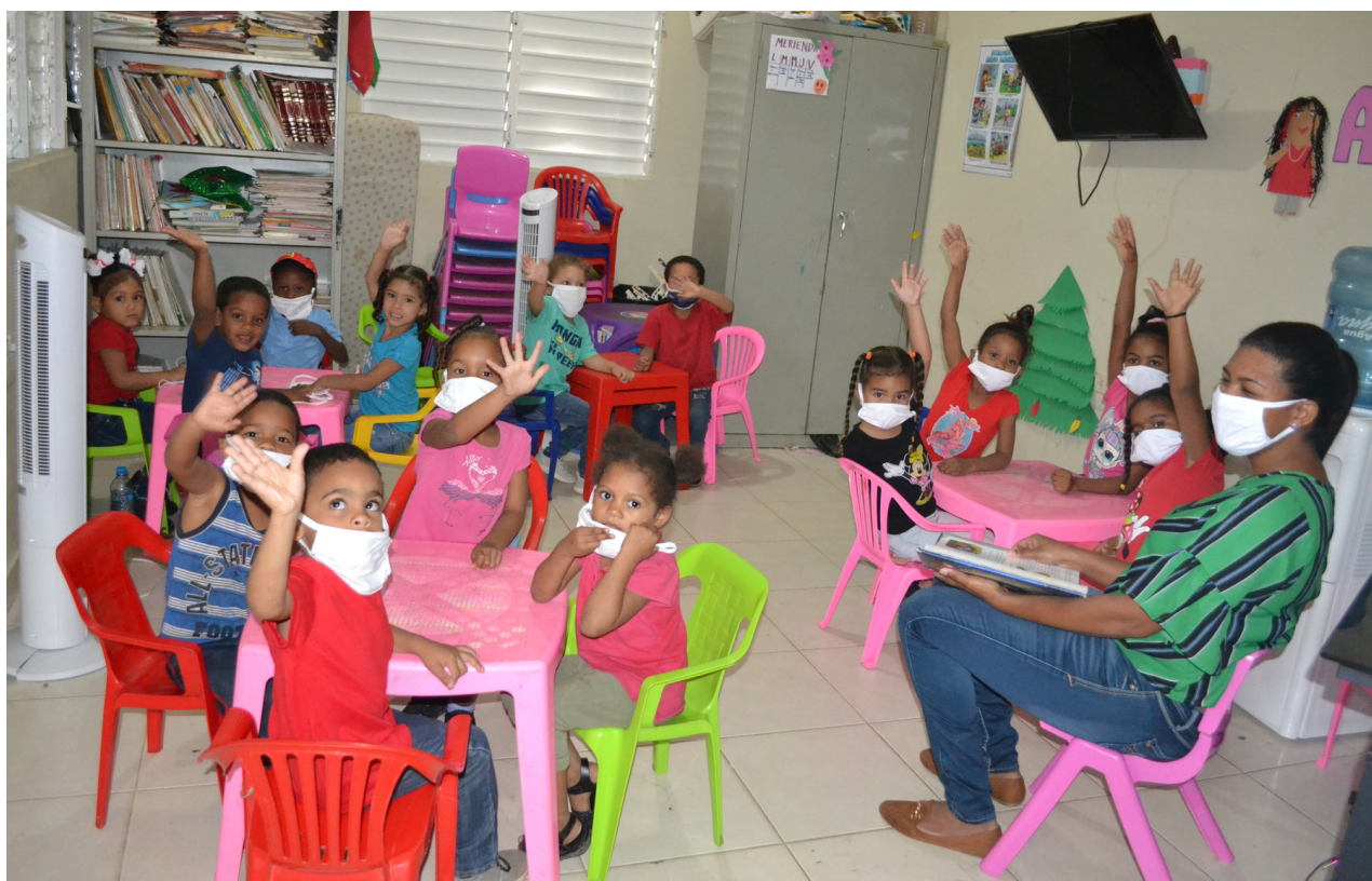
Alumnado en la Ludoteca Mauro Lorenzo

Otro efecto y valoración relevante es la utilidad que ha representado la ludoteca para las madres. Desde su inicio la ludoteca contribuyó a que aquellas con necesidad de trabajar contaran con un lugar seguro donde dejar a sus hijos. Esta condición favorable fue mucho más apreciada por las madres solteras, ya que además de representar un espacio de cuidado para sus hijos, este no generaba costo alguno. Varias madres expresaron que, gracias a la ludoteca pudieron obtener trabajos que le representaron ingresos estables que orientaron a sus hijos. Además, varias de ellas aprovecharon los programas ofrecidos por el proyecto para mejorar sus capacidades, nivel de independencia y oportunidades.