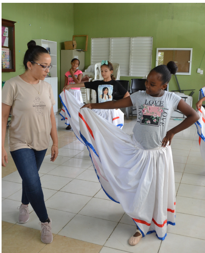
Alumnado de la Escuela de Arte y Tiempo Libre Mauro Lorenzo

En este sentido, los proyectos cuyos beneficiarios son los niños, niñas y adolescentes deben promover acciones más allá de estas edades para dar continuidad a los cambios y garantizar la sostenibilidad de lo implementado. De esta forma, desde un proyecto para la población infantil puede lograrse cambios sociales en hombres y mujeres que generan movilidad social positiva en comunidades y territorios.